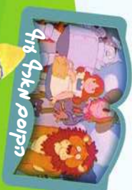
קוסם אלקי חזק