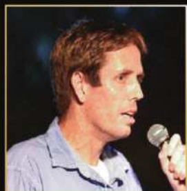
איתן חרמון אלוף העולם בריצת מרתון לנכים