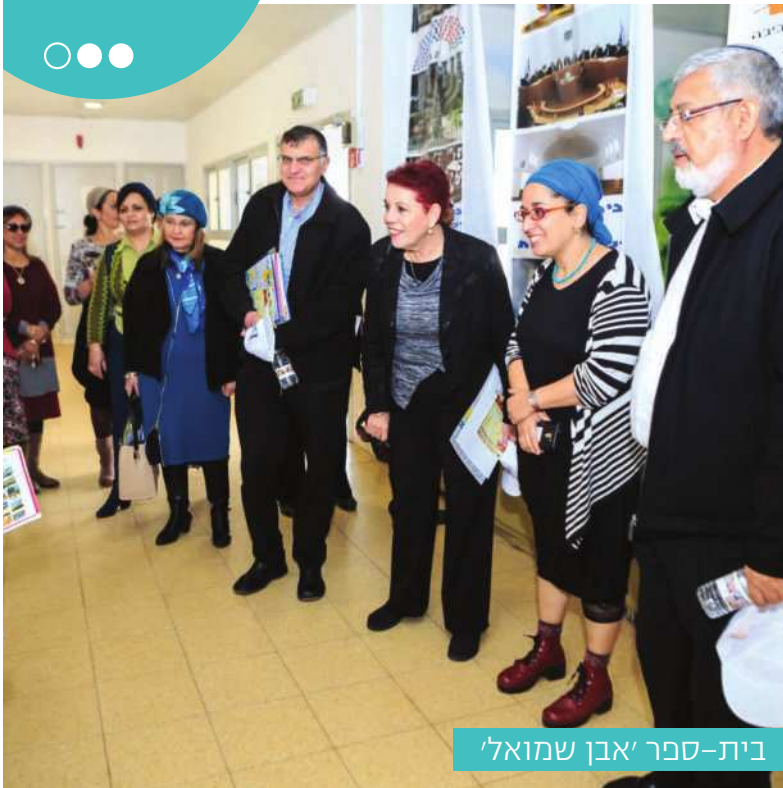
בית-ספר 'אבן שמואל'