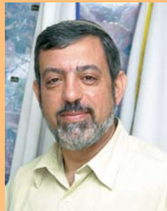
אנשי האו"ם היקרים!