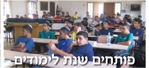
פותרים שנת לימודים