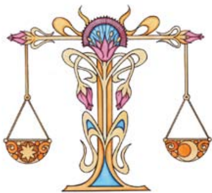
תודה מיוחדת לרב גלעד שכתב למרות ההתראה הקצרה

יהי רצון שתכתבו ותחתמו לחיים טוב ולשלום יחד עם כל עם ישראל ונזכה עוד השנה לגאולה שלמה במהרה בימינו. הרב גלעד משה.