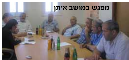
מפגש במושב איתן

מחובתי האישי להגיע אל התושבים ולשמע מקרוב על הצרכים והרצונות. מטרתנו היא שיפור איכות החיים תוך גילוי נאמנות, מסירות ומקצועיות. אני מרגיש כי המפגש הבלתי אמצעי בישובים נושא רווח כפול, אני חולק עם התושבים את המידע ומקבל מהם מידע המאפשר לי לשפר את השירותים הנחוצים, בנוסף, מנהלי המחלקות נותני השירות, זוכים להיכרות בלתי אמצעית עם בעלי התפקידים "מאחורי השופרפת". מנהיגי היישובים ציינו בסיפוק כי עצם הגעת ראש המועצה יחד עם צוותו בהרכב כה רחב אל היישוב מראה על נכונות לסייע, לשפר ולשתף פעולה לרווחת תושבי המועצה.