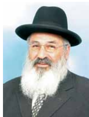
בחג השבועות אנו חוגגים את חג קבלת התורה, אנו מראים בכך שהתורה שמחה היא לנו ויום נתינתה חג הוא לנו למי אנו מראים זאת?

ראשית כל לאומות העולם אנו מראים להם שבתורה נהיינו עם, אבל לא סתם עם בין העמים אלא עם מיוחד, עם נבחר עם של "אתה בחרתנו מכל העמים" ואנו גאים בייחוסינו זה, ואין אנו מקנאים בטובתן ואושרן של אומות העולם כולן, את טובנו ואת אושרנו אנו מוצאים בדרך חיינו שתורתנו הקדושה מכוננת ומאורתה ובה בשעה שאצל האומות תופסים מקום בראש האגרוף והזרוע העליונות הטכנית וכלי המשחית המשוכללים וכל החזק מחברו בולע אותו, אנו לא כן עמנו, אשרינו שבמרכז חיינו עומדת התורה שניתנה לנו ביום זה ואין אנו נפתים ואין אנו מתפעלים מכל הערכים העולמיים שאין בהם