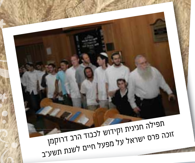
תפילה חגיגית וקידוש לכבוד הרב דרוקמן זוכה פרס ישראל על מפעל חיים לשנת תשע"ב

יז'ולון נ. א. שפיר www.shaffir.org.il ג'ולון מס' 27 ס'ולן תשע"ב