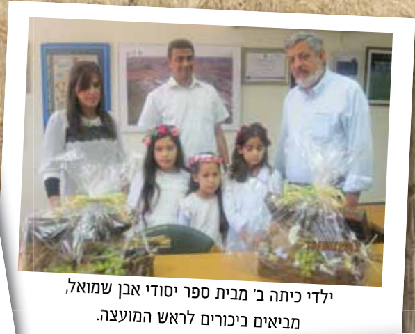
ילדי כיתה ב' מבית ספר יסודי אבן שמואל, מביאים ביכורים לראש המועצה.