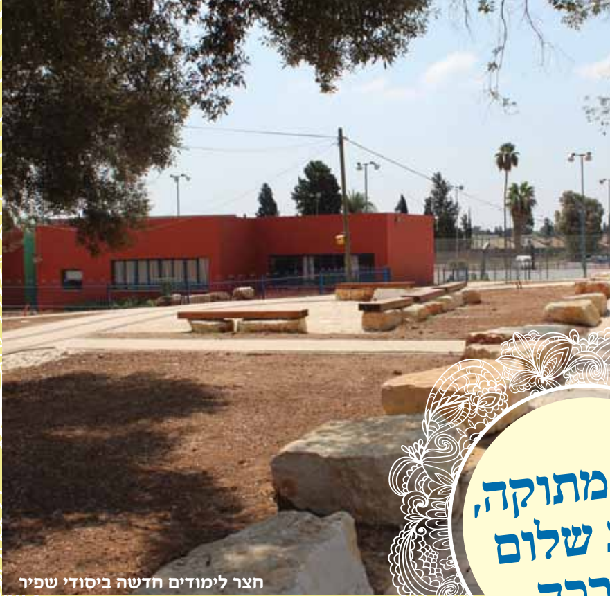
חצר לימודים חדשה ביסודי שפיר

יזיון נ. א. שפיר www.shaffir.org.il ליון מס' 30, תשרי תשע"ז