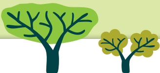
להלן טבלת זמני פינוי גזם וגרוטאות