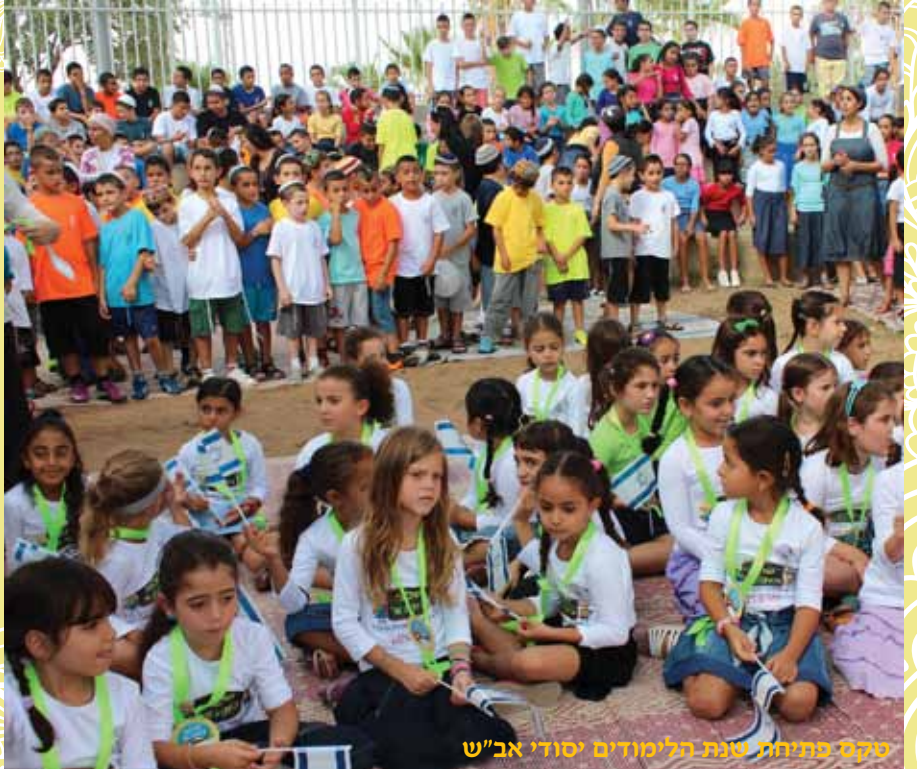
סקס פתיחת שנת הלימודים יסודי אב"ש