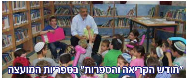
"חודש הקריאה והספרות" בספריות המועצה

מזה כארבע שנים אנו חוגגים בספריות הציבוריות בכל הארץ, את "חודש הקריאה והספרות" - שכבר הפך למסורת. בחודש זה אנו מרכזים פעילויות תרבותיות רבות, לקטנים ולגדולים ומשתדלים לחשוף את הספריות גם לקהלים שלא מגיעים דרך קבע לספרייה. הפעילויות מתקיימות באזור הצפוני: בספריית מרכז שפירא ובאזור הדרומי: בספריית אבן שמואל ובשלוחת המתנ"ס. השנה נהנו הקוראים הצעירים שלנו ממגוון הצגות, סדנאות, מפגש עם המאייר המוכשר שי צ'רקה ופעילות למבוגרים בשתי הספריות. שיתוף הפעולה בין המתנ"ס לספרייה בחודש זה, הוא פורה ומפריה והתוצאה מחממת את הלב. עשרות רבות של ילדים ומבוגרים אשר פוקדים את הספריות ונהנים ממגוון הפעילויות המוצע להם.