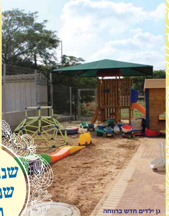
גן ילדים חדש ברוחה