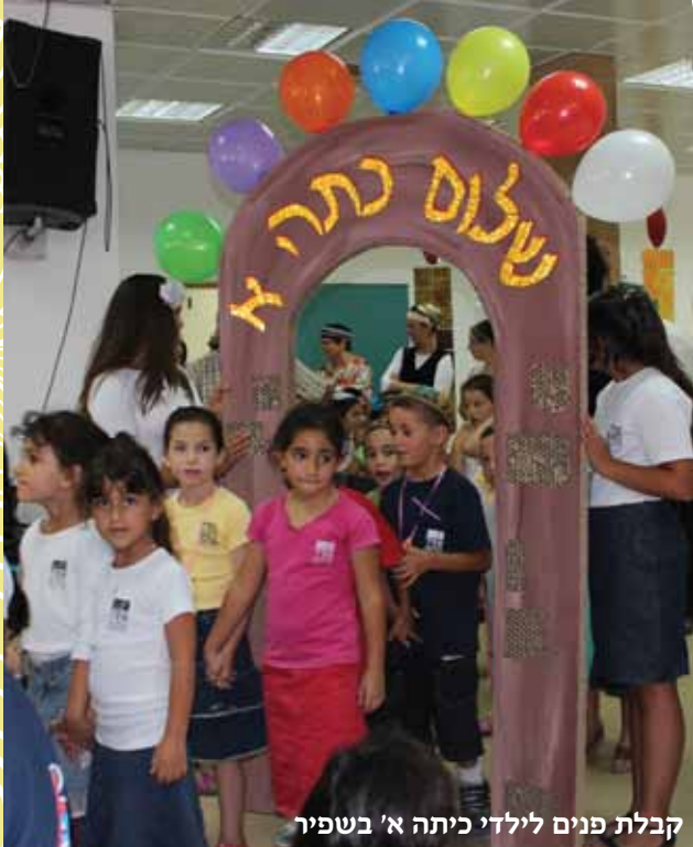
קבלת פנים לילדי כיתה א' בשפיר