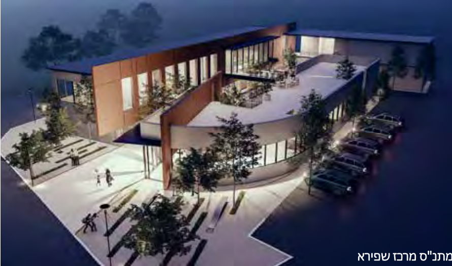
מתנ"ס מרכז שפירא