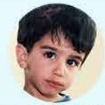
המיזם לעילוי נשמת תום מוכתר ז"ל